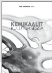
Kemikaalit kulutuksessa Taru Anttonen (toim.)

VISION KIRJAT PUOLUKOKOUSTARJOUKSENA 10 EUROA (NORM 15 EUROA)